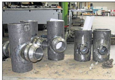
Absperrorgane: So nennt der Fachmann derartige Gebilde. Sie regulieren später Gas, Öl oder Wasser, die durch Rohre fließen.